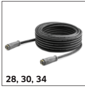
28, 30, 34