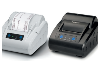
Safescan TP-230 Thermo-Belegdrucker Art. no: 134-0475 Grau Art. no: 134-0535 Schwarz