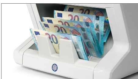
Wertzahlung für gemischte EUR, GBP, CHF, PLN, SEK, NOK und DKK Banknoten