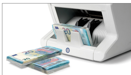
Bündel-Funktion zur an Banknoten