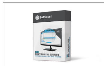
Safescan MCS Software Art. no: 124-0500