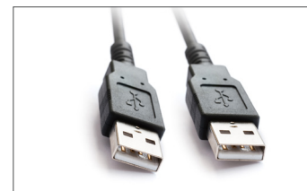
Safescan USB Update-Kabel Art. no: 124-0458