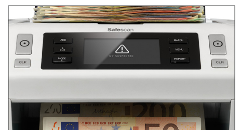
Akustisches und visuelles Alarmsignal