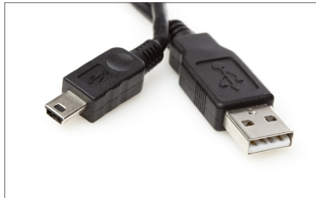
Safescan USB Update-Kabel Art. no: 112-0459