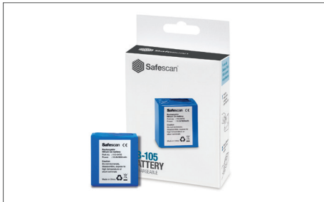
Safescan LB-105 Aufladbare Batterie Art. no: 112-0410