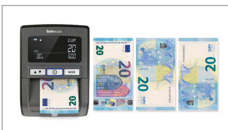
Euro-Banknoten können in beliebiger Richtung eingelegt werden