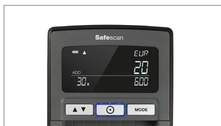
Zeigt Menge und Gesamtbeträge