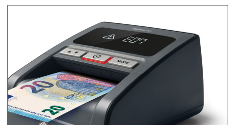
Akustisches und visuelles Alarmsignal