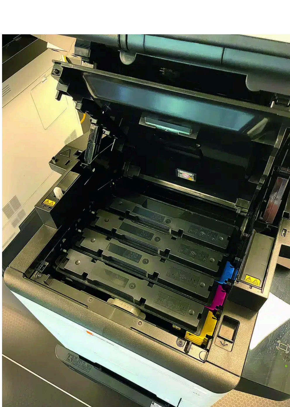
Saubere Sache: Der UTAX P-C4067i MFP verwendet vier separate Tonerkartuschen für jede Farbe: Schwarz, Cyan, Magenta und Gelb. Jede Kartusche ist speziell für hohe Druckvolumina entwickelt und ermöglicht eine gleichmäßi-ge, scharfe und lebendige Farbwiedergabe.

Funktionalität wird bei UTAX großgeschrieben. Daher wurden die Systeme der Serie unter anderem mit speziellen Mobile-Features ausgestattet, die für effizientes Arbeiten von unterwegs sorgen. Weitere nützliche Features sind unter anderem der USB-Direktndruck, die Ausweiskopie, die Leerseitenerkennung, Air-Print, Mopria-Scan und vieles mehr.