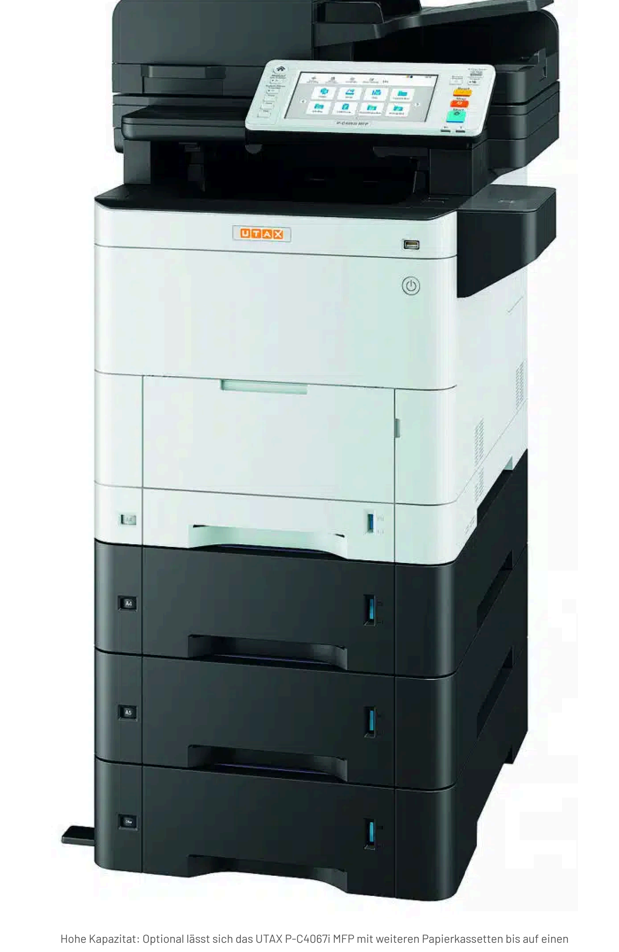
Hohe Kapazität: Optional lässt sich das UTAX P-C4067i MFP mit weiteren Papierkassetten bis auf einen Papiervorrat von bis zu 2.000 Blatt aufrüsten.