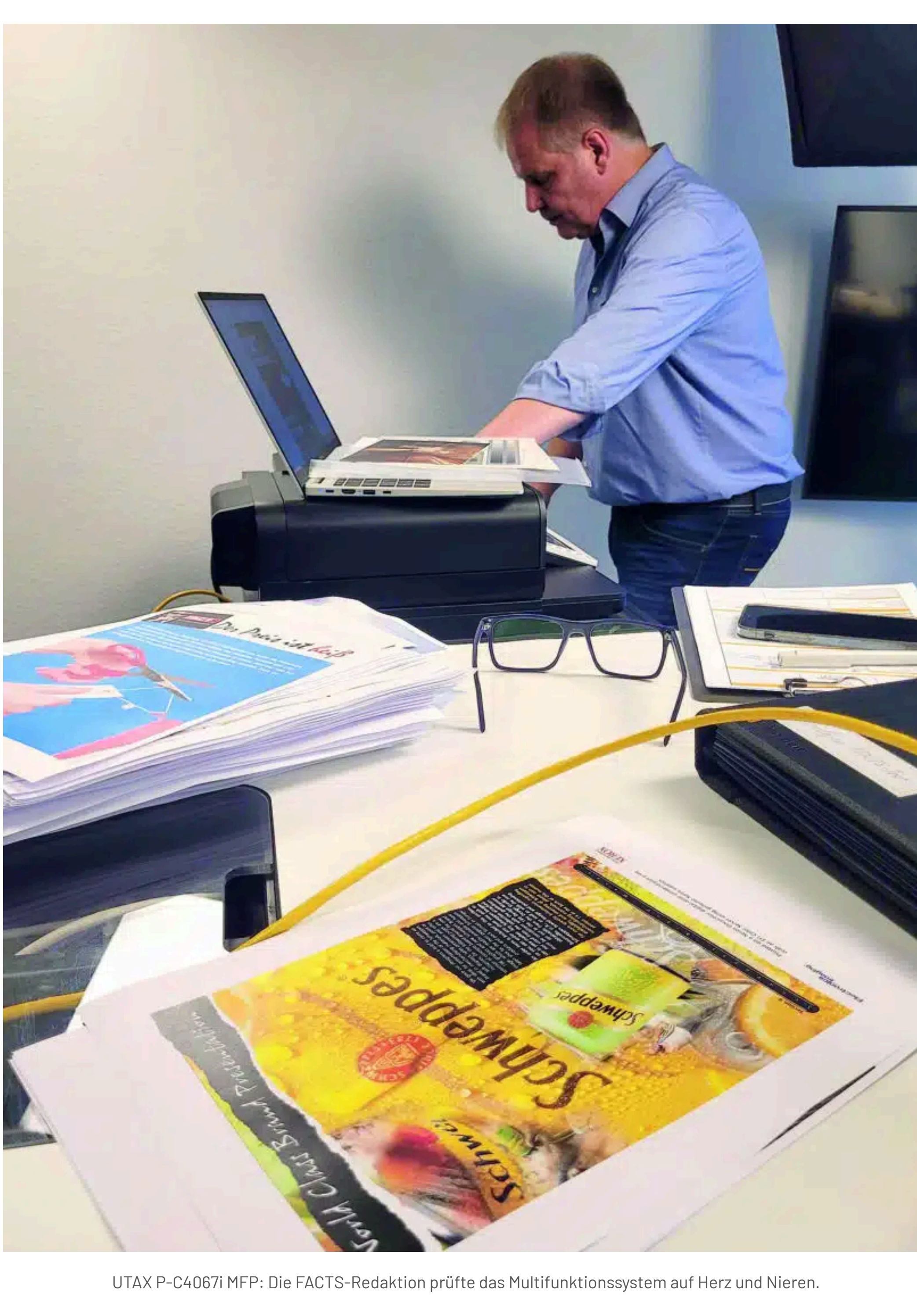
UTAX P-C4067i MFP: Die FACTS-Redaktion prüfte das Multifunktionssystem auf Herz und Nieren.

Auch in Sachen Qualität hatten die FACTS Redakteure kaum etwas zu bemängeln: Den Druck von Graustufen und Farbverläufen meisterte das Gerät vorbildlich. Während es beim Kopieren ganz kleine Schwächen bei der Erstellung von sehr dunklen Fotos gab, brachte der Druck der digitalen Testvorlagen außergewöhnlich gute Ergebnisse.