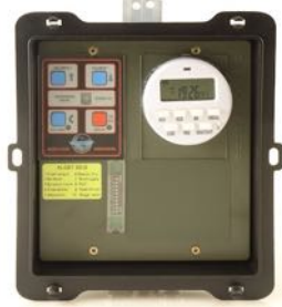
HANDLEIDING ALCETSOUND VOGELWERING (ALCE-LIM)