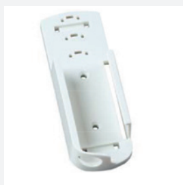
EBI 300-WM2 Wall Mount for EBI 300 / 310

Meerdere externe sensoren mogelijk. Meer informatie beschikbaar op aanvraag.