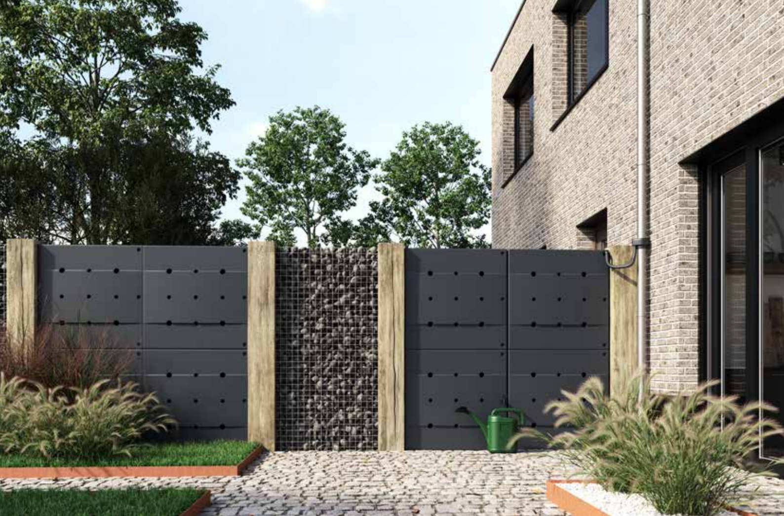
De Rainblock geplaatst als tuinafscheiding.