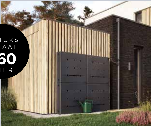
Kleur: Zwart, geplaatst als muuropstelling

We love Rain. Dat klinkt misschien vreemd, maar toch is het zo. Door het veranderende klimaat zullen we steeds verantwoordelijker om moeten gaan met drinkwater. Overheid en gemeenten sturen steeds meer aan op opslag van regenwater voor gebruik op momenten dat je het water wel nodig hebt. Met het innovatieve Rainblock®-systeem kun je op een efficiënte en mooie manier regenwater opslaan. Dankzij het compacte ontwerp kan de Rainblock® verwerkt worden in een tuinafscheiding of muuropstelling. Het modulaire systeem kan worden uitgebreid met infiltratiekratten of bijvoorbeeld een bewateringssysteem.