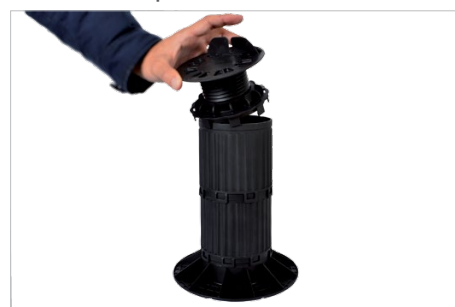
Verhoogbus (model 270-470 mm)