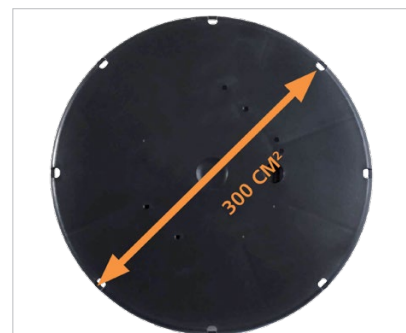
Grote voet, weinig druk