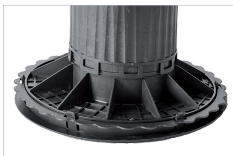
Helling corrector 0-7%