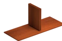
Dakplaat ter plaatse te lassen