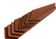
Stalen piket ter plaatse te lassen

*De kantopsluitingen worden ongeroest afgeleverd, met enkele weken/maanden zijn de ze volledig geroest. Hoewel de patina permanent is, kan het voorkomen dat er, zeker in de eerste maanden, onder invloed van bijv. regen wat uitspoelt / afgeeft.