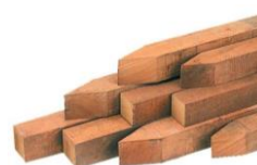
Hardhouten piket schroefbevestiging