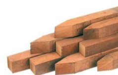
Hardhouten piket schroefbevestiging

*Thermisch verzinken is een proces waarbij het metaal wordt voorzien van een laag zink door het onder te dompelen in een bad van gesmolten zink van ca. 450° Celsius. De robuuste zinklaag zorgt na afkoeling voor een bescherming tegen corrosie / roesten.