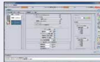
2. Thematisch zusammenhängende RIP-Einstellungen sind in einem Fenster zusammengefasst und lassen sich zur wiederkehrenden Nutzung als Favoriten ablegen.