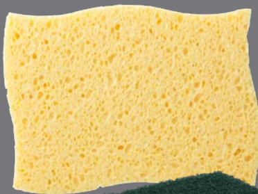
REYNST SCHILDERSPONS WAVE V25 - 5 stuks per folie