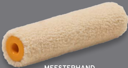
MEESTERHAND LAKROLLER PREMIUM VILT 10cm - 10 stuks per doos