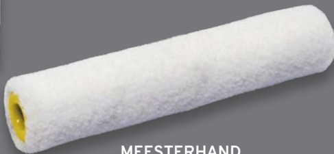
MEESTERHAND LAKVILTROLLER 6mm/10cm - 10 stuks per doos