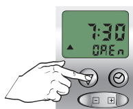
kort indrukken, OP tijd knippert