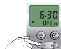
Stel de OP tijd in

GEEN OP tijd gewenst: kies dan de OFF tijd, deze komt na 23:59