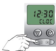
Stel huidige tijd in