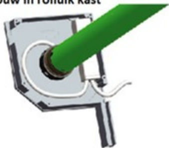
inbouw in rolluik kast

Draad naar beneden zodat heen (regen) water in de behuizing kan komen. De witte uitstekende draad is de antenne. Niet verwijderen en niet in de behuizing steken.