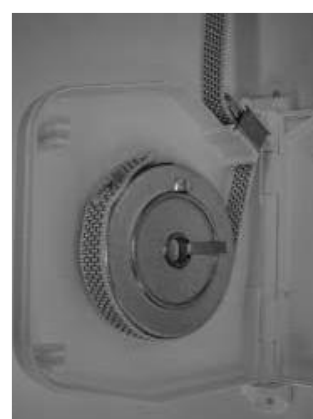
Klem het ingeknipte band achter het opstaande palletje.