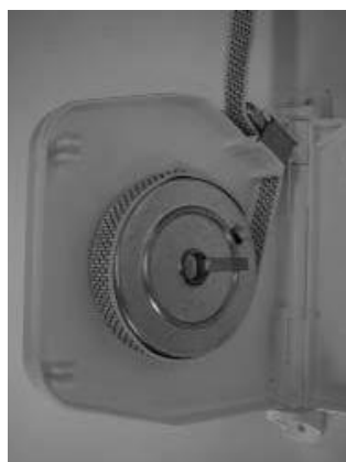
Druk het opstaande weerhaakje naar achteren.