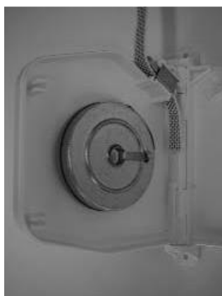
Voer het band door de rem.