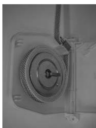
Laat de veer rustig afrollen.