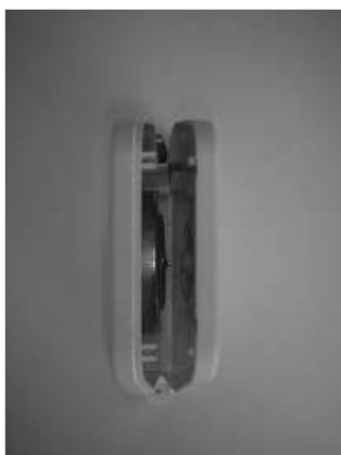
Open de bandwinder.