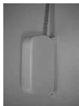
Sluit de bandopwinder.