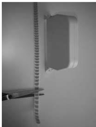
Knip het band ± 25 cm Voorbij de bandopwinder af.