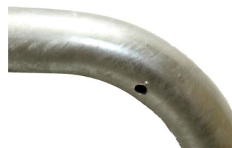
Fietsbeugel met tussenbuis Arceau à vélo avec barre transversale