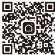
【Smart Life】 App