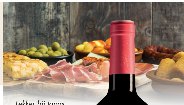
Lekker bij tapas