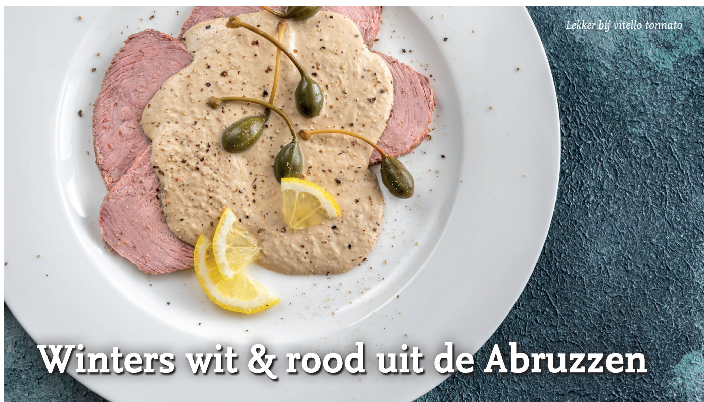
Lekker bij vitello tonnato