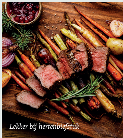
Lekker bij hertenbiefstuk

De Selvarossa is het paradepaardje van de familie Maci, eigenaar van Cantine Due Palme. Due Palme bewijst met deze wijn dat ook in Salento, in de Zuid-Italiaanse regio Apulië, topwijnen gemaakt kunnen worden. Hun beste wijn heeft al vele malen de hoogste waardering van tre bicchieri (drie glaasjes) behaald in de Italiaanse wijngids Gambero Rosso. Uiteraard is voor u vooral de smaak en wijnstijl van belang: deze is rijk en soepel. De wijn is gemaakt van overwegend superrijpe en flink ingedroogde negroamarodruiven, aangevuld met een beetje malvasia nera. Tijdens de lange gisting ontstaat een mooie diepdonkere kleur. Daarna rijpt de Selvarossa negen maanden lang in nieuwe kleine eikenhouten fusten van Franse origine. Door de volle, ronde smaak en de rijpe aroma's is 'ie perfect voor bij een stevige maaltijd of als luxe avondwijn.