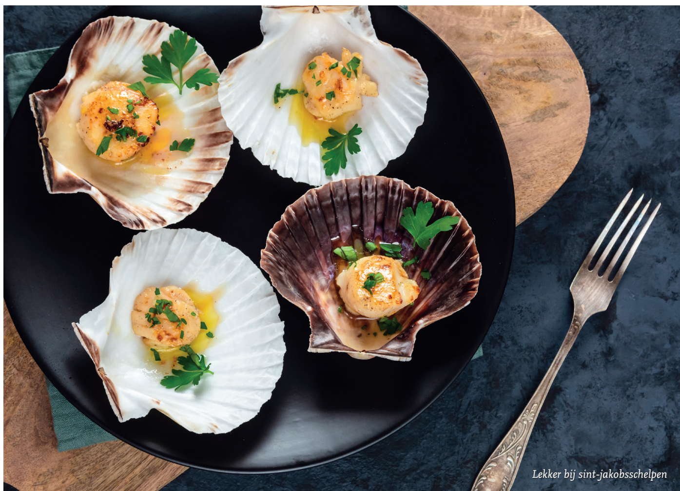
Lekker bij sint-jakobsschelpen