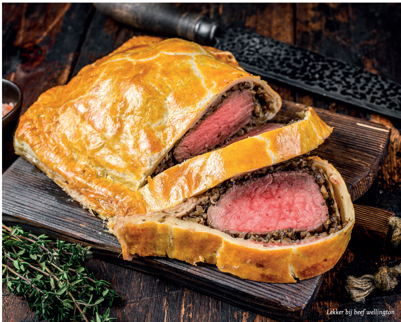
Lekker bij beef wellington