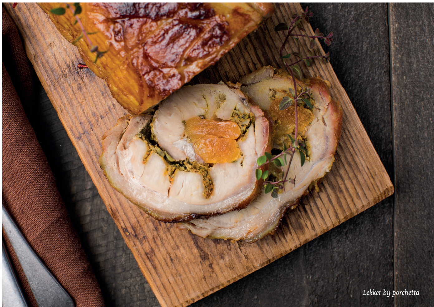
Lekker bij porchetta