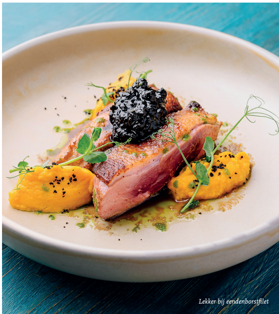
Lekker bij eendenborstfilet