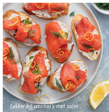
Lekker bij crostini's met zalm

93/100 punten | Incredible intensity JAMESUCKLING.COM - OKTOBER 2025