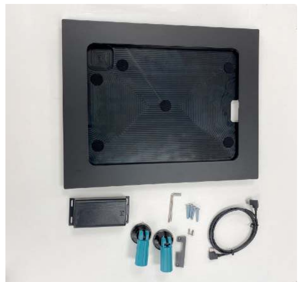
level mit PoE Adapter („level PD“)